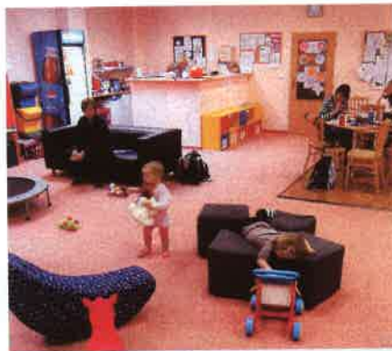
Rodinná atmosféra v RC Paleček.

teré navštíví až 270 lidí. Tým centra tvoří celkem 8 lidí, kteří spolu plánují a tvoří aktivity a 16 stálých lektorů. A cože právě letí? „Nejvíce naplněné máme kurzy Písnička, které jsou muzikální a děti to pod vedením Hanky Gabrielové nesmírně baví. Dále Batolátka a Džunglováníčko, které vede naše téměř éterická bytost Arnoštka Štěrbová. A největší perlou je kurz pro budoucí muže – Kutílci. Zde je lektorem náš jediný muž v týmu Vojta Pavelčík, který učí pražské